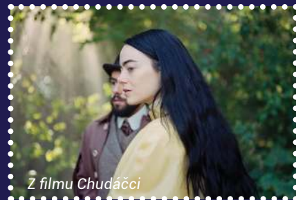
Z filmu Chudáčci

• 02.–22.01.2024 – v pokladních hodinách kina